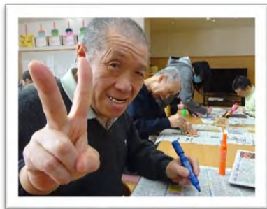
皆さん上手に作れました☆彡

【よさこいの鳴子制作と踊り♪】2月7日、段ボールでオリジナルの鳴子を制作し、その後体育館でよさこいの「よっちょれ」を踊りました。過去によさこいを踊ったことのある利用者さんが多く、皆さん自由に鳴子を振り踊っていました。