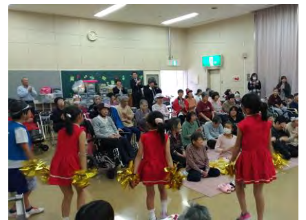
温根湯小学校のみなさん