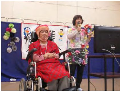
「太陽がくれた季節」を歌いました

11月14日に芸能発表会を行いました。各棟の利用者さんが仮装をしながらカラオケを行いました。今年も温根湯小学校の児童たちが来苑してくれ、踊りを披露してくれました。短い時間でしたが、地域の子ども達ともふれあうことができ、楽しいひとときを過ごす事ができました。