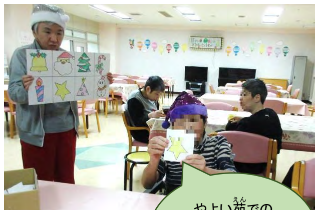
やよい苑での クリスマス会も 楽しかった♪