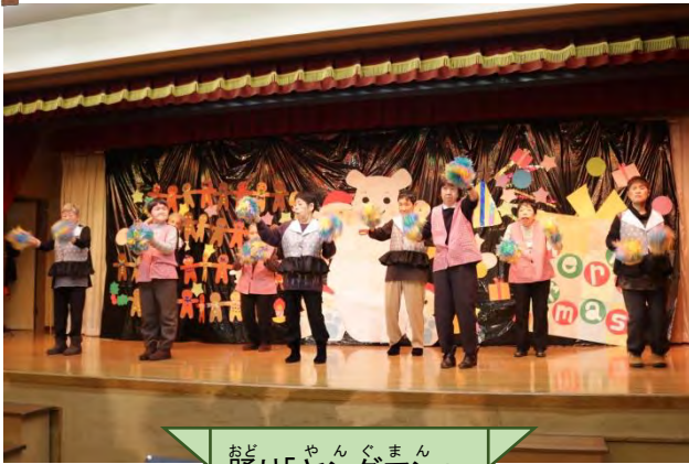
おど 踊り「ヤングマン」

12月27日に光星苑・やよい苑合同クリスマス会を開催いたしました。アトラクションでは、カラオケや踊りなど皆さん一生懸命練習した成果を発揮されていました。また、ご家族の方と一緒にご馳走を食し、ビンゴなどを一緒にいき、とても楽しまれました。ご家族の皆さま、お忙しい中参加していただき、ありがとうございました。