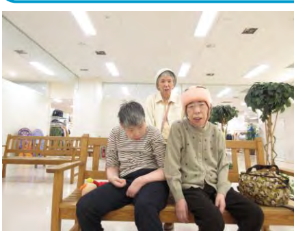
【日帰り旅行】買い物を楽しんだり、美味しい物を食べて遊んでました♪