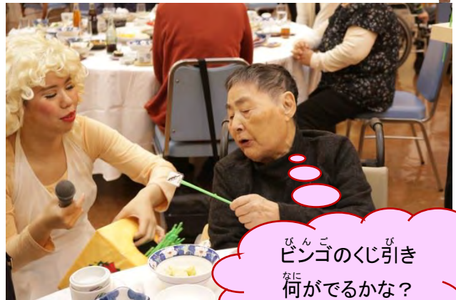
ビンゴのくじ引き なにがでるかな？